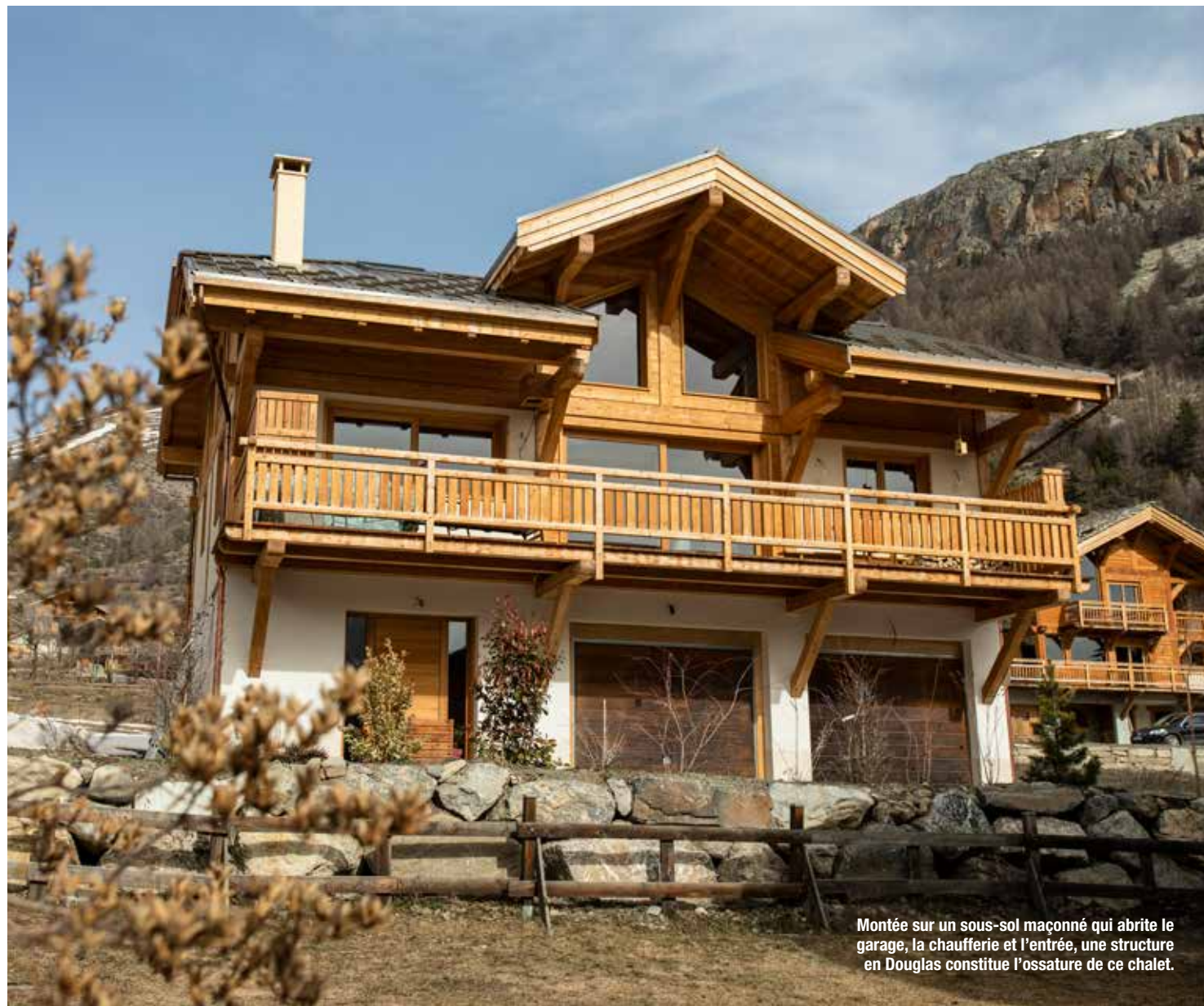
Montée sur un sous-sol maçonné qui abrite le garage, la chaufferie et l'entrée, une structure en Douglas constitue l'ossature de ce chalet.