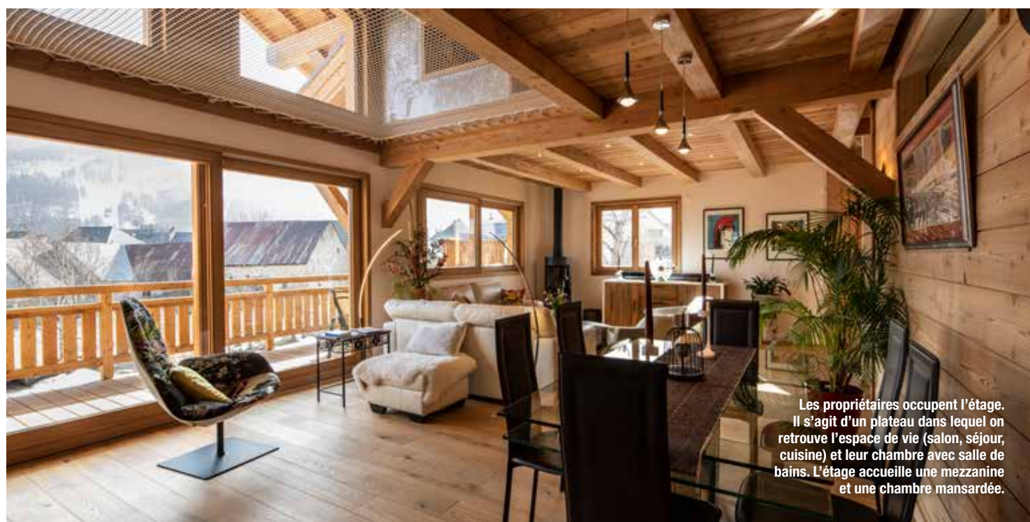
Les propriétaires occupent l'étage. Il s'agit d'un plateau dans lequel on retrouve l'espace de vie (salon, séjour, cuisine) et leur chambre avec salle de bains. L'étage accueille une mezzanine et une chambre mansardée.