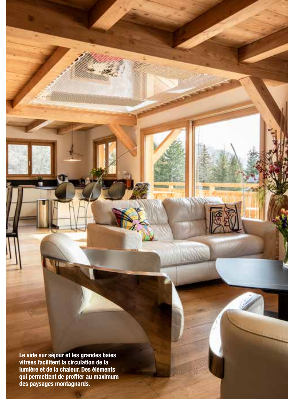
Le vide sur séjour et les grandes baies vitrées facilitent la circulation de la lumière et de la chaleur. Des éléments qui permettent de profiter au maximum des paysages montagnards.